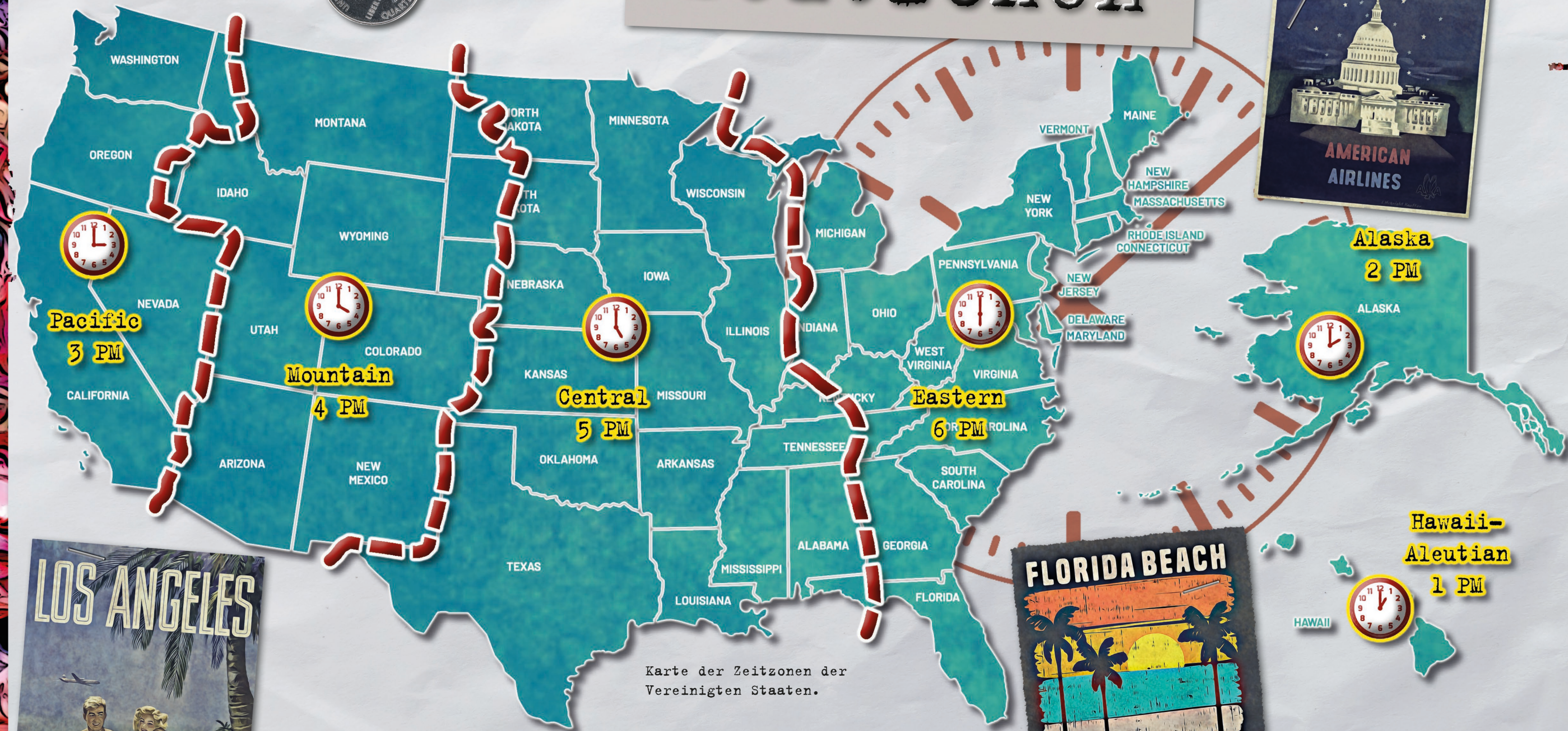
Karte der Zeitzonen der Vereinigten Staaten.